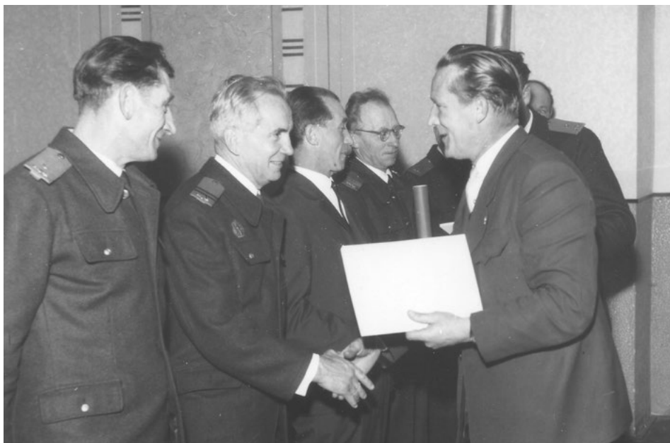
Předávání hasičského ocenění v Nové Vsi