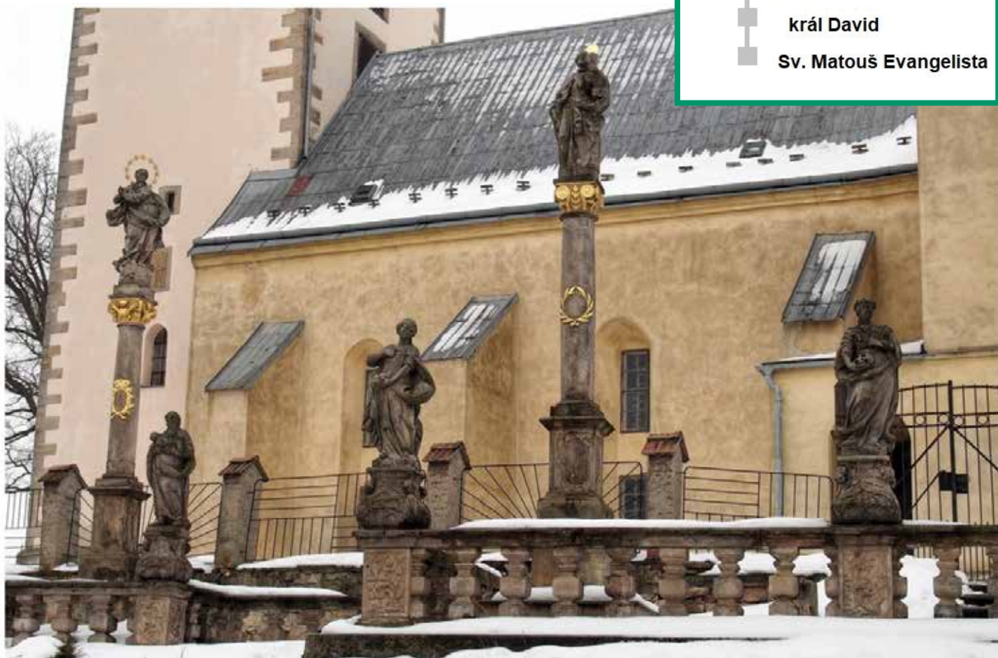
Sousoší balustrády: zleva Panna Marie, sv. Jáchym, sv. Pavlína, sv. Barbora, sv. Rozálie