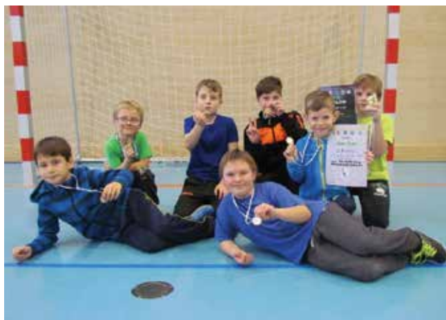
Foto: Filip Kolbábek, trenér přípravy TJSK – Přípravka na turnaji