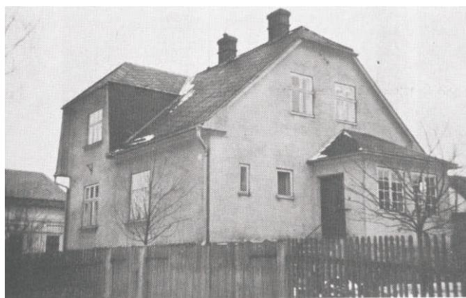
Dům čp. 230 Berkovi r.1932 a r. 2014