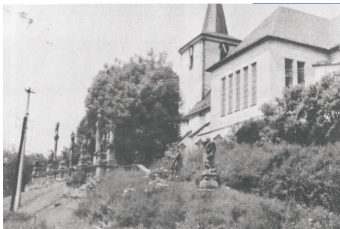
Kostel r. 1976 a r. 2014